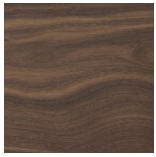
NOCE CANALETTA Canaletta Walnut